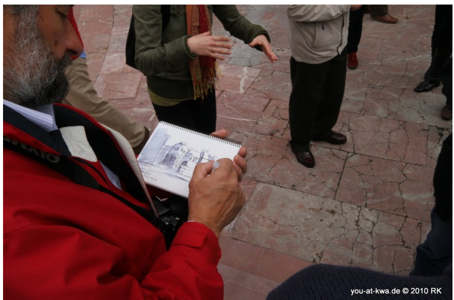
· oviedo · künstler bei der arbeit · yak

Muchas fotos de la gira, la entrega de premios y de los monumentos de Oviedo, he recopilado en WEB-Photo Album .oviedo.