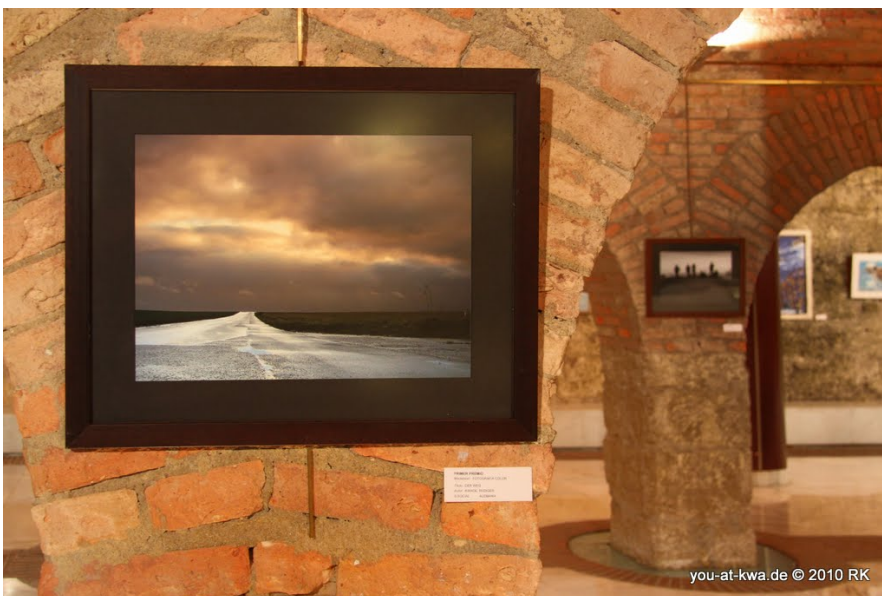
· oviedo · "der weg" im auditorium-congress center · yak