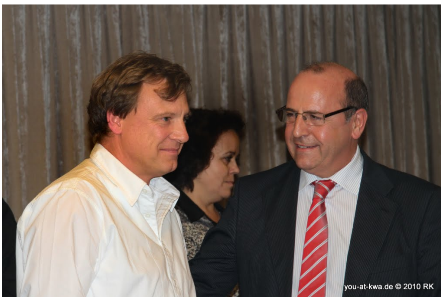
· oviedo · preisverleihung im hotel barceló cervantes · yak © 2010 RK