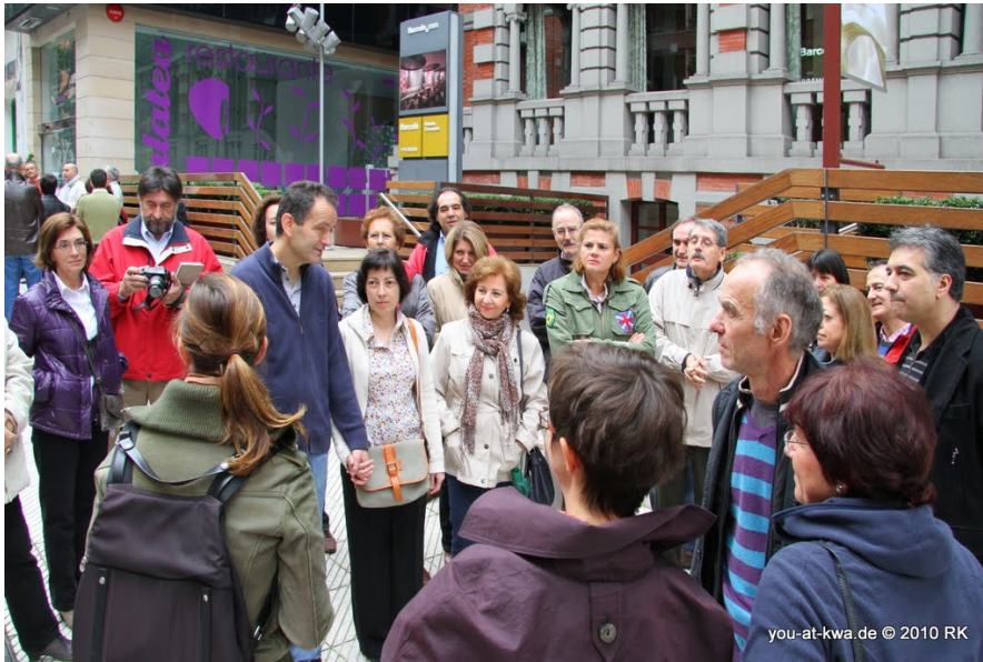
· oviedo · stadtführung · yak

El sábado, al 6 de noviembre, estaba planeado una guía a través de Oviedo. Hay que saber que Oviedo es la inoficial capital cultural de España y en las tres horas que duró la guía solo podíamos visitar las curiosidades turísticas más importantes.